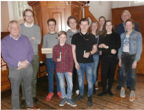
De steen, hier nog in handen van de jeugd