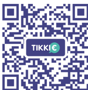
Diaconie Eigen Jeugd